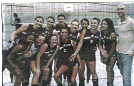
Les filles faisaient preuve d'un bel optimisme en début de saison avec leur coach à droite.