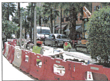
Thouron-Mip est un des 105 arrêts concernés par des travaux d'aménagements.

Ces modifications s'inscrivent dans le cadre de la loi du 11 février 2005 qui impose aux communes de