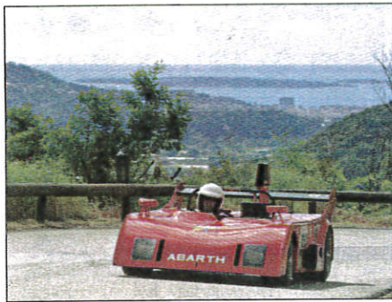
Une Abarth de légende ce week-end.