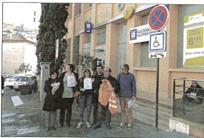
Les salariés de La Poste attendent l'arrivée d'un « agent encadrant ».

« Depuis le 1 er janvier, le secteur de La Poste "Grasse-Peymeinade" comprend en plus Saint-Cézaire, Saint-Vallier, Spéracède et Cabris », explique