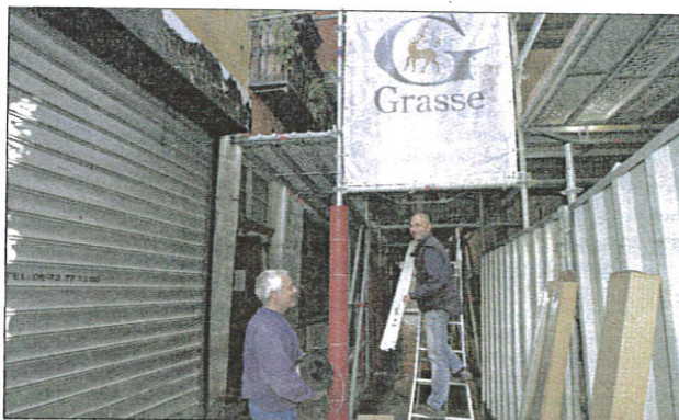
Marcel-Journet côté pile (ci-dessus) hier, avec la pose de luminaires et de fausses plantes grimpantes. Et côté face (à droite)... plus obscur jusqu'ici pour les commerçants très impactés après l'effondrement de l'échafaudage et d'une partie de l'îlot Mougins-Roquefort en cours de réhabilitation par la SPL Pays de Grasse Développement.

Le retour des beaux jours devrait leur redonner un peu le sourire avec, ils l'espèrent, une belle cohorte de clients. D'autant que cette fois, c'est sûr, après s'être assurée que les abords de l'îlot Mougins-Roquefort, partiellement effondré le 18 novembre 2015, étaient parfaitement sécurisés, la municipalité a décidé de rendre dès aujourd'hui le passage piéton rue Marcel-Journet libre. Le tunnel aménagé pour permettre la circulation des piétons a été éclairé hier et agrémenté de faux jasmains grimpants sur les échafaudages. Lesquels sont déjà bâchés de motifs à fleurs depuis la fin de semaine dernière en