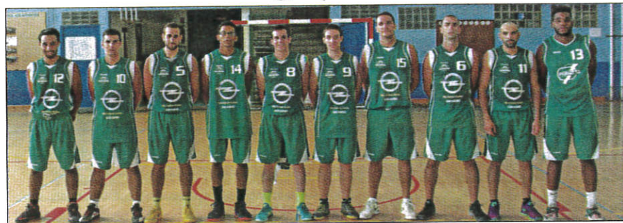
Dernière prestation à domicile de la saison pour les seniors de l'U.S. Grasse.

Les deux équipes ne partagent pas le même classement car les Grassoises précèdent les Cagnoises d'un tout petit point : ils comptabilisent 29 points avec 9 victoires et 11 défaites, contre 8 et 12 pour l'U.S. Cagnes-sur-Mer.