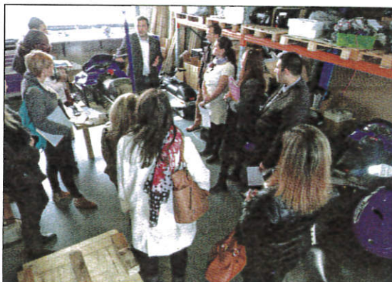
Visite guidée par le patron, dans l'atelier de montage de motoneiges (à moteur thermique) reconditionnés en électriques par la société de scooters Eccity Motorcycles.

1. L'antenne Pôle Emploi du pays grasseois, la Mission locale du pays de Grasse, la CAPG, la CCI Nice Côte d'Azur, EBG, la Région Paca.