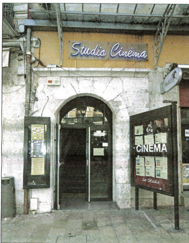
Malgré le fait qu'il soit passé en régie municipale, le cinéma peine toujours à sortir la tête de l'eau...