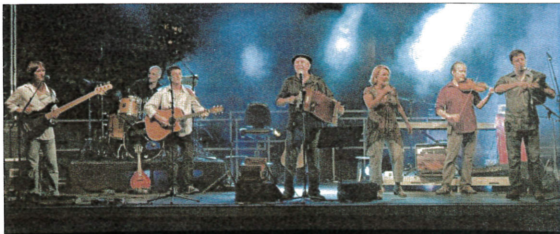
La plupart des concerts du groupe ont lieu à guichets fermés, preuve de leur succès.

Nous sommes un groupe qui ne peut pas partir, poursuit-il. Nous sommes du territoire et nous gérons tout, du producteur au consommateur. On se permet de choisir et c'est assez rare. » Très peu médiatisé, le groupe remplit pourtant les salles et joue régulièrement à guichets fermés. Le secret de leur longévité ? « Nous