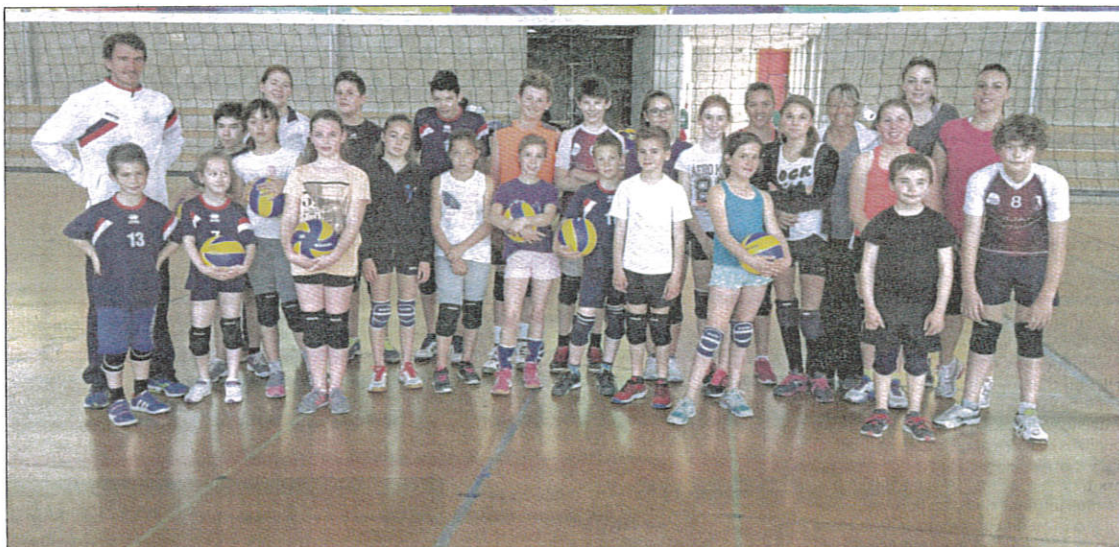
Les jeunes pousses du club de volley étaient tout sourire durant ce stage de vacances.