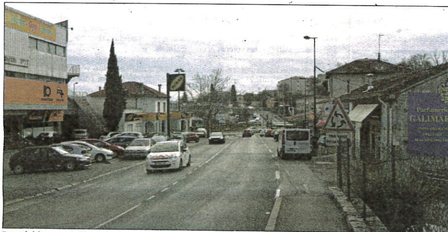
Des résidences abritant des logements sociaux verront le jour boulevard Georges-Pompidou dans le secteur des Quatre-Chemins.

Sous le centre-ville, 140 logements verront le jour dont 101 logements sociaux comportant 53 hébergements pour les personnes âgées. Le rapport de présentation