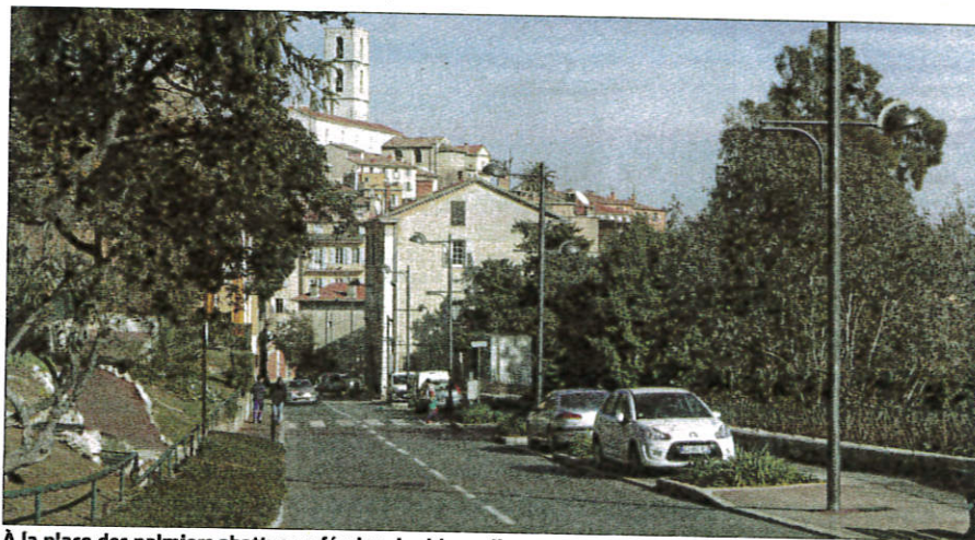
À la place des palmiers abattus en février, des bigaradiers – ou « orangers amers » – devraient être plantés sur le boulevard Fragonard.

Et les Grassois ont tranché de manière claire ! Sur le