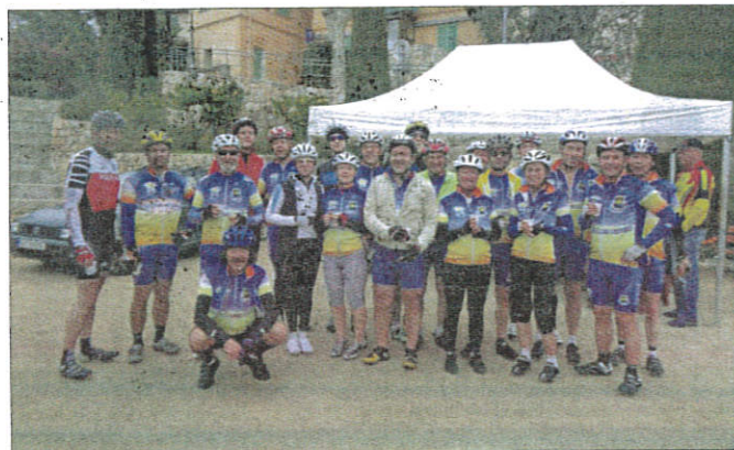
Un groupe de gais lurons lors du passage au pointage du Bar-sur-Loup.

Classement clubs FSGT : 1. AC Bar-sur-Loup; 2. Gazélec; 3. AS Air France. Autres clubs : 1. AS Saint-Jeanet; 2. JFC Nice; 3. AVIC Saint-Vallier; 4. AC Grasse; 5. Azur Évasion; 6. GSEM Nice; 7. Cyclo Touriste; 8. ASL Guillaumes; 9. CC Cagnes; 10. AC Valbonne; 11. OCC Antibes; 12. Cent Cols.