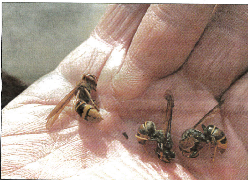
Le frelon asiatique, au centre et à droite, est plus noir et plus petit que le frelon commun, à gauche.