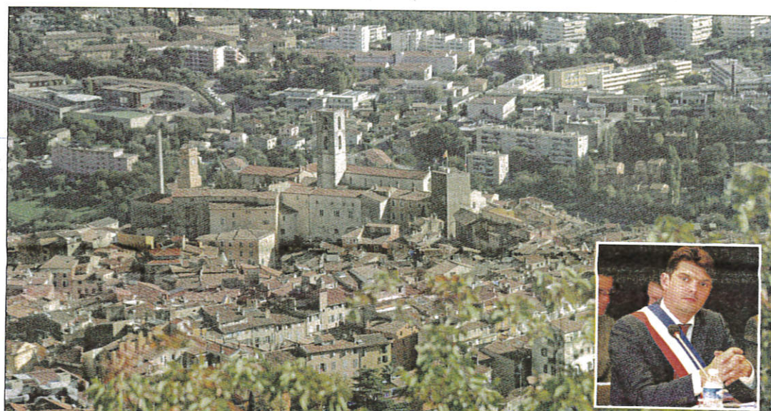
La ville compte 13,81 % de logements sociaux quand la loi en impose 25 %. Le maire a demandé à l'État de signer un contrat de mixité sociale. Objectif : fixer à 15 % l'objectif d'ici à 2020... Il dit être toujours dans l'attente d'un retour.

banc des 11 villes les plus médiocres en la matière à côté de villes qui ont 0 % ou 2 % de logements sociaux... Nous sommes à 14 % (13,81 %, selon les chiffres du rapport, NDLR) et nous avons 3 190 logements sociaux. Faudra m'expliquer pourquoi. Mais je sais ce qu'ils vont me répondre : "Oui mais vous partez