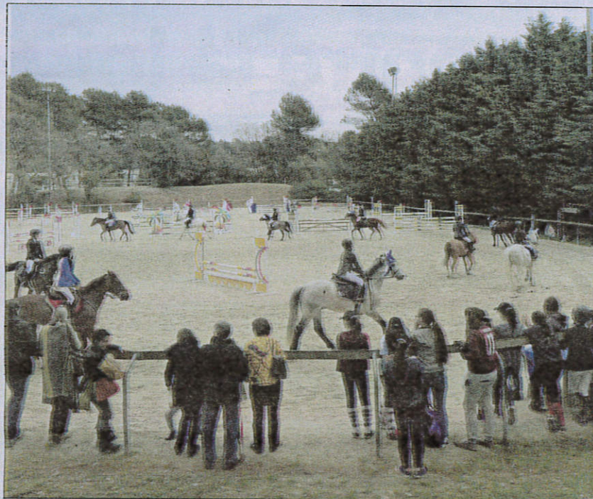
Hier, toute la journée, de nombreuses épreuves se sont déroulées sur la piste du Club Hippique de Grasse. Avec des obstacles de plus en plus hauts.