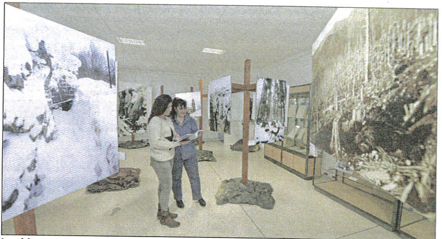
Les visiteurs peuvent voyager dans le temps dans une ambiance forestière.

L'occasion pour elles de découvrir le lien qui unit les Alpes, d'où sont partis les soldats en 1915, aux Vosges où ils ont combattu. Ce qui transparait dans ces images c'est l'émotion. « On voulait chercher ce que l'on peut ressentir cent ans après les combats », continue