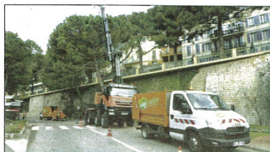
D'ici demain, les dix pins parasols du haut de l'avenue seront abattus.

Après l'abattage, place au ravalement des racines, au rognage des souches et à la préparation des trottoirs jeudi prochain. Vendredi