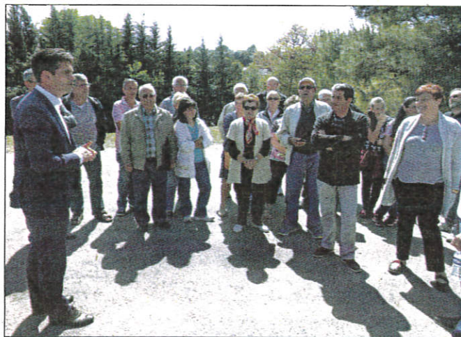
Le chemin des Bastides était une des étapes de cette revue de quartier.