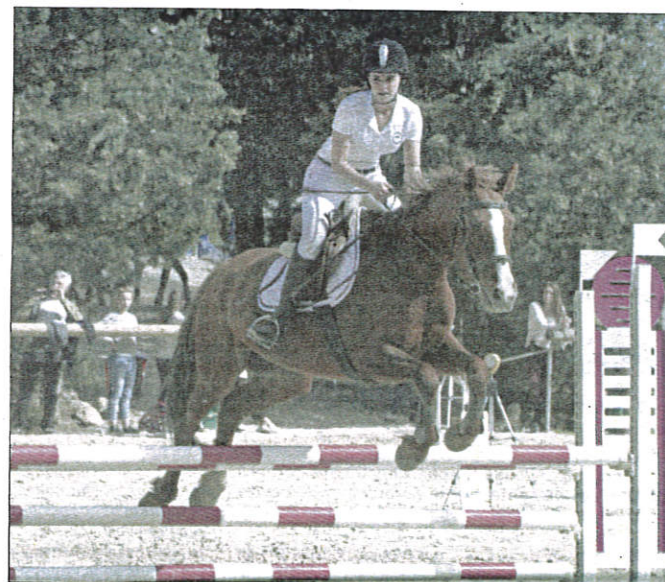
Concours, remise des prix et passage au paddock pour les cavalières hier lors de la première journée de la tournée des AS.