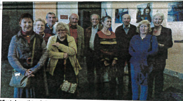
Vingt-cinq artistes du Pays grassois (peintres, sculpteurs et vitraillistes) exposent leurs œuvres au Palais des Congrès de Grasse depuis hier soir. L'exposition a lieu jusqu'au 20 avril. On peut la découvrir en entrée libre du lundi au vendredi de 9 h à 12 h 30 et de 13 h 30 à 17 h, ainsi que le samedi de 9 h à 17 h.