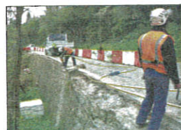
Visite du chantier de sécurisation de la route départementale 13, sur le bd Schley.

Le maire a vivement remercié les équipes des services techniques de la Ville pour leur travail quotidien quartiers St-François et des Marronniers. À gauche, inauguration du passage en sens unique du chemin du Souvenir, à la demande des riverains.