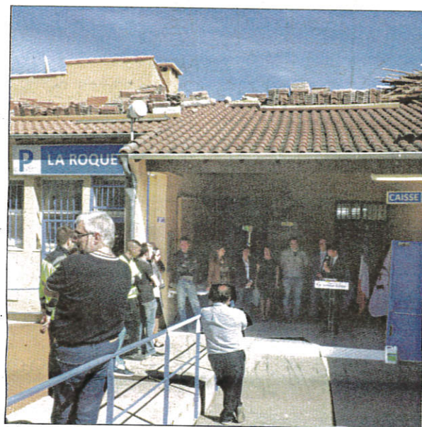
Déployé sur 24 demi-niveaux, le parking de La Roque s'est modernisé. Des couleurs pour faciliter la reconnaissance des étages, une double barrière en sortie pour éviter les fraudes et des caméras font partie des améliorations apportées lors des travaux de rénovation.

Autre amélioration pensée pour satisfaire un maximum de Grassois : l'accessibilité. Une rampe a en effet été aménagée afin de permettre aux personnes à mobilité réduite de se rendre à la caisse automatique. Et c'est au niveau de la sortie que le parc de stationnement municipal a voulu miser sur la modernité. Une double barrière permet