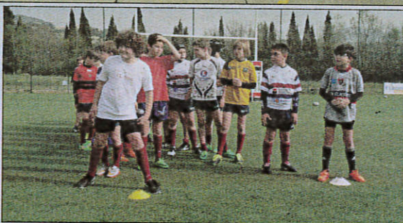
Les jeunes pousses du ROG se sont éclatées lors du stage omnisports en pratiquant de nombreuses disciplines comme l'escrime ou le tir à l'arc.