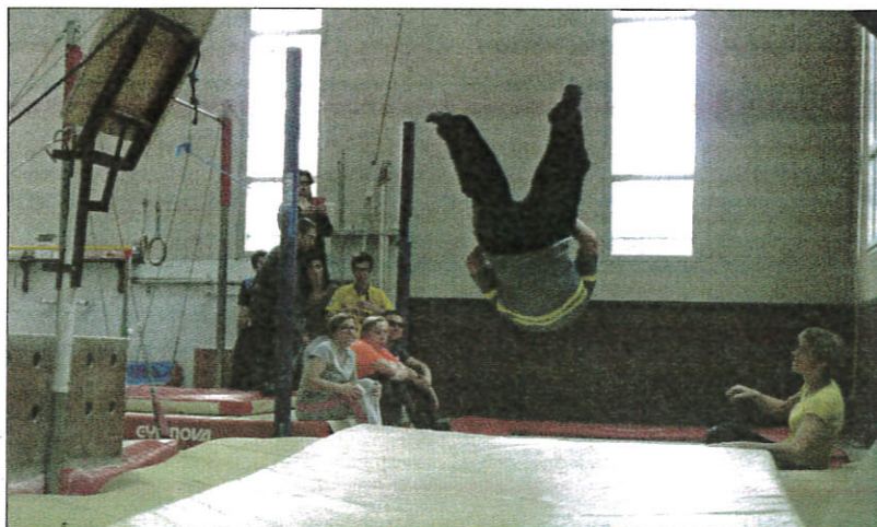
Atelier roulade – ou salto pour les plus téméraires – en clôture de cette onzième et dernière session de gym destinée aux jeunes de la SAT La Cardeline.

« Ce projet a été extrêmement bien accueilli, déclare Isabelle