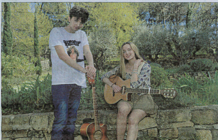
Les deux jeunes Azuréens ont prouvé que le talent n'attend pas le nombre des années.