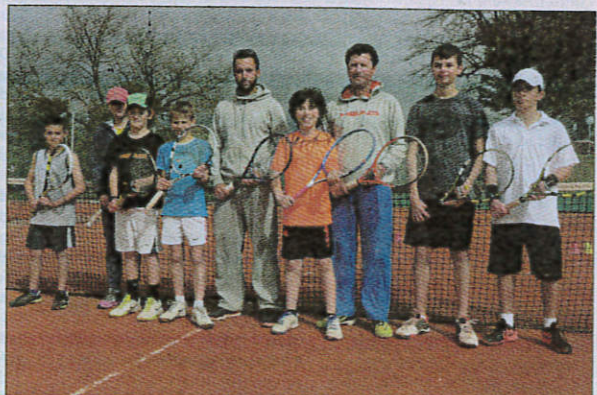
Les jeunes du TCG se préparent aux compétitions cette semaine à La Paoute.