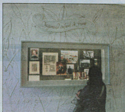
90 ans de parfum, 1926-2016 retrace l'histoire de la maison Fragonard.