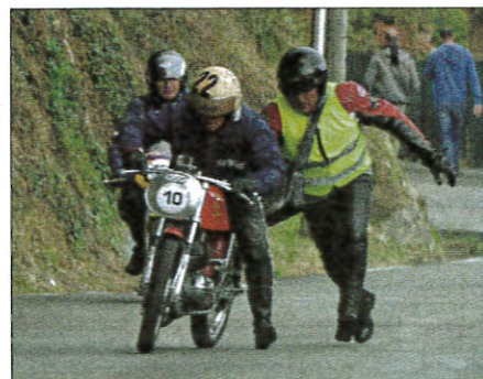
Un peu d'aide pour redémarrer et c'est reparti !