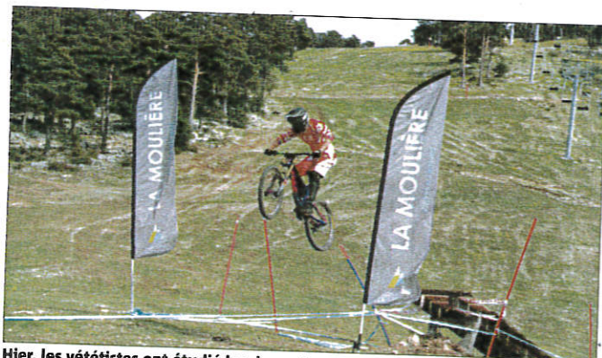
Hier, les vététistes ont étudié les descentes.