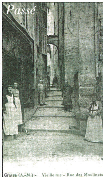
Grasse (A.-M.) - Vieille rue - Rue des Moulinets

Cette venelle longue et pentue se déroule de la place aux Aires à la rue Droite. Le cadastre de 1433 la désignait alors sous le vocable de « Carriera Molendinorum . »