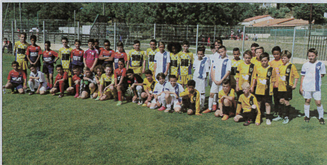
Les U11 ont fait le spectacle hier sur la pelouse de Gaston-Marchive lors de la seconde et dernière journée de la 39 e édition du tournoi de Pentecôte de l'US Pégomas.

Côté sportif, ce sont les U11 de Saint-Jean-Beaulieu qui ont décroché le titre en battant en finale l'AS Cannes aux tirs au but. Chez les U13, succès, en finale, du RC Grasse 2-0 face à l'US Pégomas. Enfin, pour les U15, victoire de l'AS Cannes 1-0 devant Mandelieu. Trois clubs différents victorieux