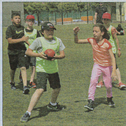
Concentration extrême pour ces jeunes joueurs.