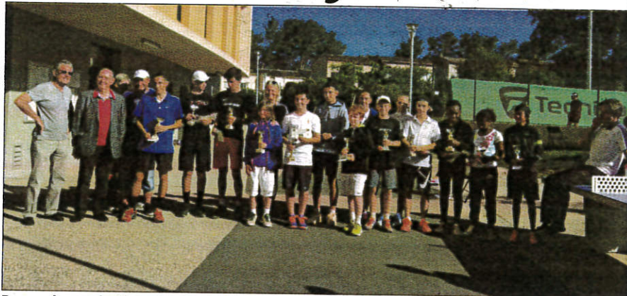
Des sourires sur les lèvres des vainqueurs et finalistes récompensés à l'issue de deux semaines de rencontres.