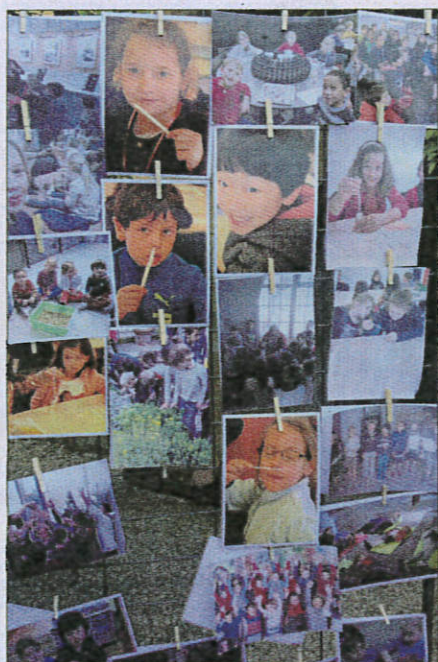
Vendredi soir, le Jardin des Orangers, au MIP à Grasse, accueillait les parents pour découvrir les œuvres de leurs enfants.

Vendredi soir, aux alentours de 19 heures, le corps enseignant, les élèves et les parents étaient réunis pour découvrir le résultat final. Pour l'occasion une exposition des travaux des en-