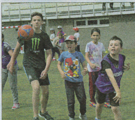
Des différences de tailles sur le terrain !