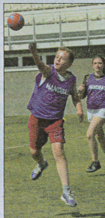
Tir en extension.