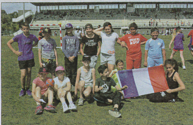
L'équipe «France» a brillé sur le synthétique de La Paoute.