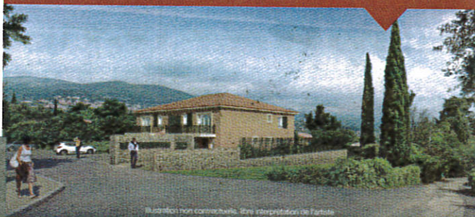
Illustration non contractuelle. Sans interprétation de l'artiste

Tous nos duplex sont équipés d'espace de lumière et de verdure !