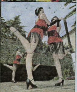
Hier, les Boogies Men ont joué au palais des congrès pour la clôture la 46 e édition d'ExpoRose. Après quatre jours d'animations à travers toute la ville, Grasse se débarrasse de ses habits de fêtes.