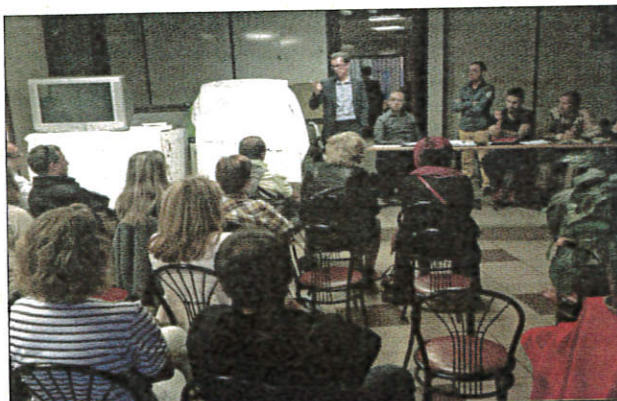
Parmi les sujets à l'ordre du jour, le projet Martelly a été développé auprès des commerçants qui ont pu poser des questions.

Puis placé au bilan financier. « Les points crédités sur les cartes sont en hausse de 3,58 %, annonce un membre du bureau. Soit un total de 413 609 euros pour 10 000 porteurs de carte. » En revanche, les points débités sont à -3,26 %, avec un panier moyen de 30 euros par achat.