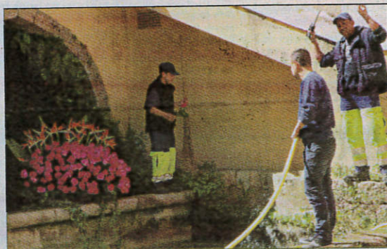
Les agents municipaux de la Ville veillent à l'arrosage et à la stabilité des installations fleuries, comme ici fontaine de l'Évêché.