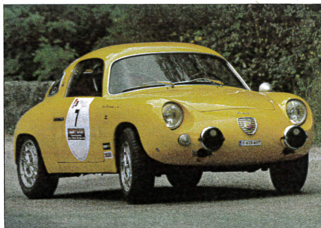
Il y en avait pour tous les goûts et toutes les couleurs hier à Pégomas.