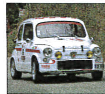
Mini voiture, maxi plaisir.