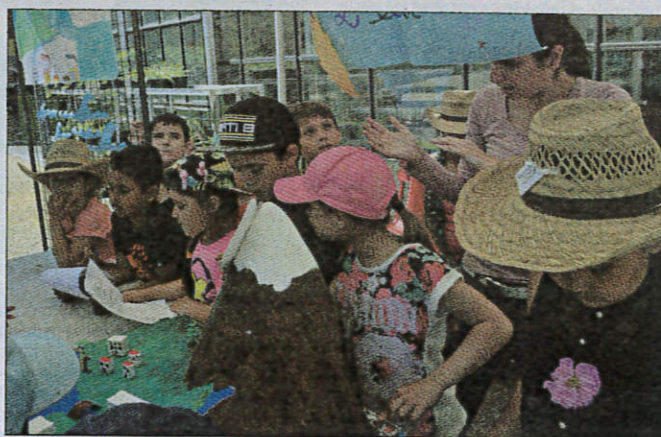
Les écoliers de la Roquette-sur-Siagne ont détaillé le cycle de l'eau.