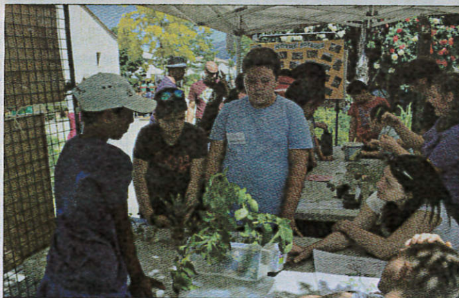
La classe ULIS de Saint-Exupéry a étudié le jardin potager.