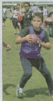
«C'est mon ballon !».