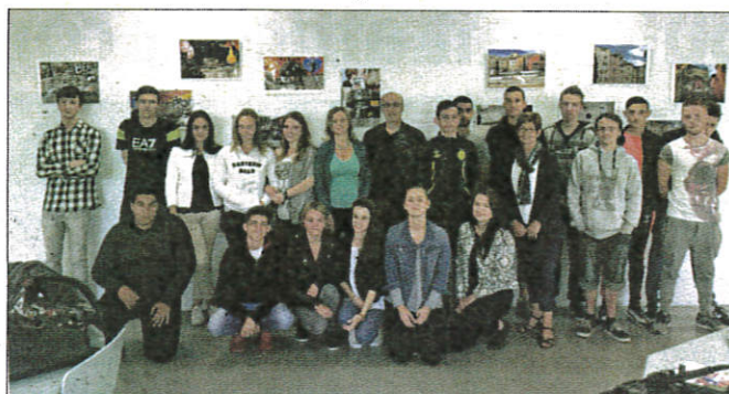
Les élèves et leurs professeurs devant leurs œuvres.

Un autre groupe, à la suite d'un voyage scolaire, a travaillé sur la ville de Berlin. « Leurs travaux sont volontairement confus et chaotiques, comme l'histoire de