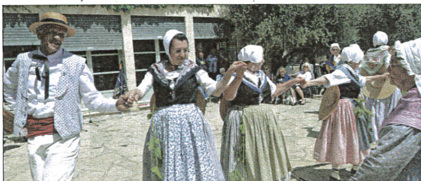
Après la messe chantée par le groupe, puis la danse de la souche avec la bénédiction du prêtre, le groupe a alterné chants et danses.

Trois ans plus tard, le groupe défilait sur les Champs-Élysées le 14 juillet pour le bicentenaire de la Révolution ! L'histoire continue depuis. En 1993, l'Aïgo a été admis comme membre du Rode de Basse-Pro-