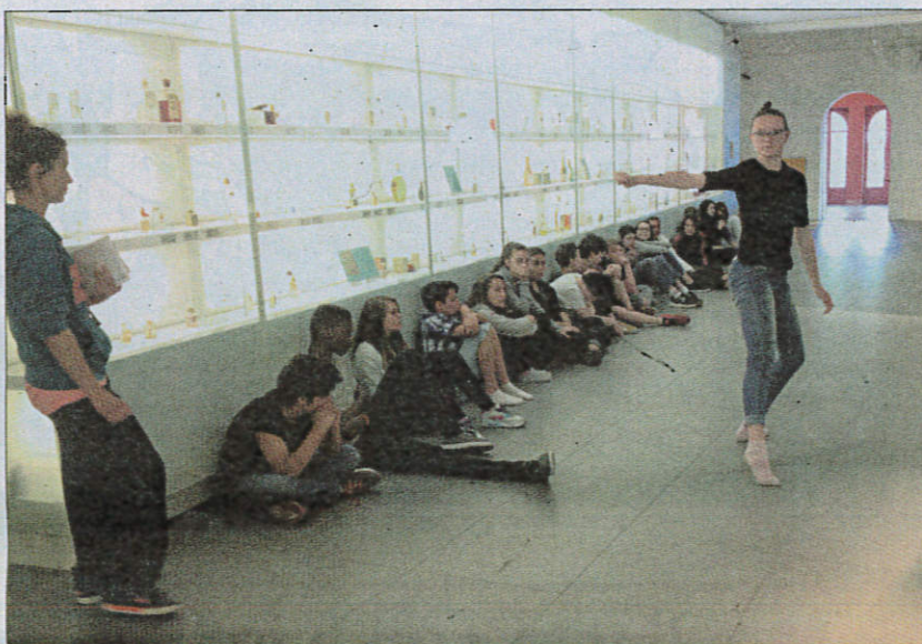
Les élèves du collège Saint-Hilaire sont venus répéter dans la semaine, en conditions réelles, le spectacle qu'ils présenteront ce soir au MIP.

La classe de 4 e sera d'ailleurs associée à une autre classe, de 3 e cette fois, et d'un autre établissement, le collège de La Chênaie, à Mouans-Sartoux. Tous composeront une partie du spectacle présenté ce soir au MIP: une performance chorégraphique sur le thème de l'exposition estivale du musée, De la belle époque aux années folles . En tout, plus de 40 collégiens vont se relayer de 19h30 à 23h30. Ils devront danser en silence sur une chorégraphie qu'ils ont eux-mêmes créée. Les répétitions étaient en tout cas très prometteuses. Certains se sont même découverts une aisance et une facilité dans cet exercice. Ne reste plus qu'à vaincre le trac ce soir, car ils devront effectuer leurs chorégraphies au milieu des visiteurs, en plein musée.