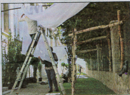
Les fleuristes grasseois ont décoré toute la ville, notamment l'allée des Bains.