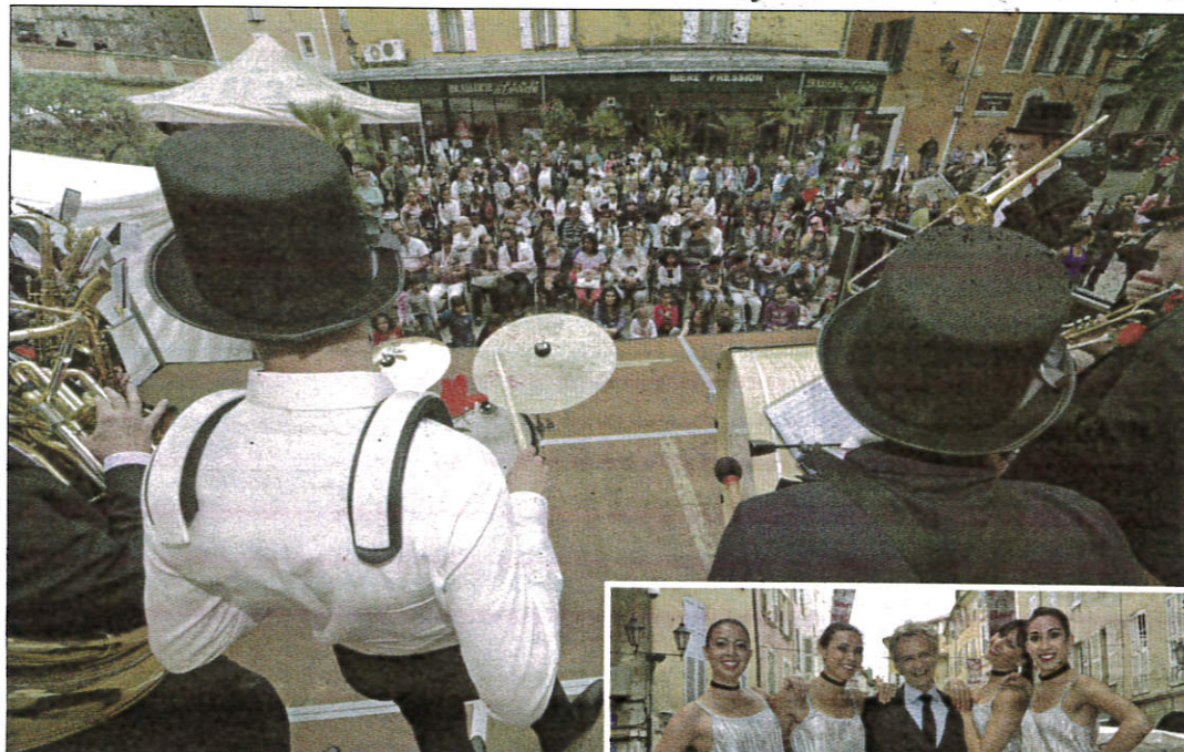
Foule sur la place de l'Évêché au moment du spectacle burlesque imaginé par Eric Monvoisin.

Si, selon un habitué, «la fréquentation de l'exposition sous chapiteau semble être un peu moins