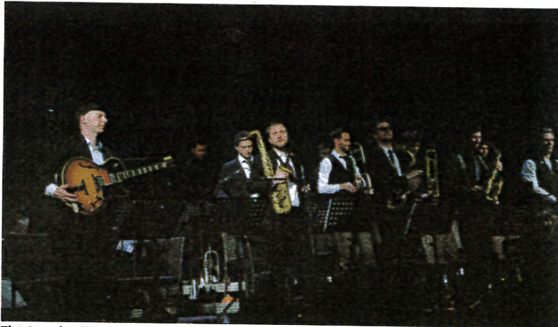
The Amazing Keystone Big Band dans Pierre et le Loup , il faut le voir (l'entendre) pour y croire.

Le rôle-titre, Pierre, est incarné par la section rythmique ; l'oiseau, par la flûte et la trompette ; les chasseurs, par les trompet-