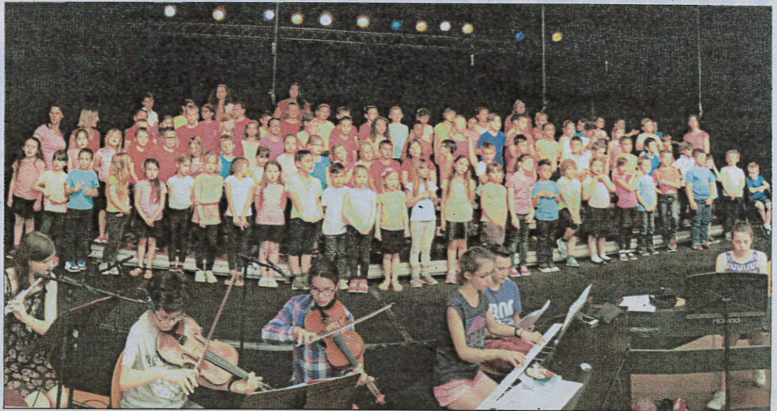
Hier, les élèves de Sainte-Marthe et Jeanne-d'Arc ont chanté à 18 h 15, avant de laisser place aux élèves de Dracéa à 20 h 30.

Guidés par leurs institutrices et accompagnés par les élèves musiciens du conservatoire de Grasse, bambins et plus grands se sont impliqués pour que la soirée d'hier soir, leur soirée, soit une réussite ! Jeudi soir, ce sera au tour des écoliers de Saint-Exupéry de s'élancer sur scène, avant les élèves des Cigales, de Saint-Jacques, Antoine-Maure et Saint-Antoine qui chanteront vendredi soir.