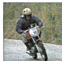
Un vrai style à l'ancienne.