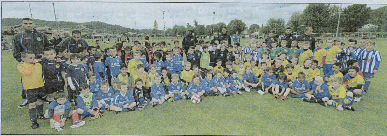
Près de 480 joueurs des U6 aux U9 ont mis le feu au stade Gaston-Marchive, hier, pour le premier rendez-vous en mai de l'US Pégomas.