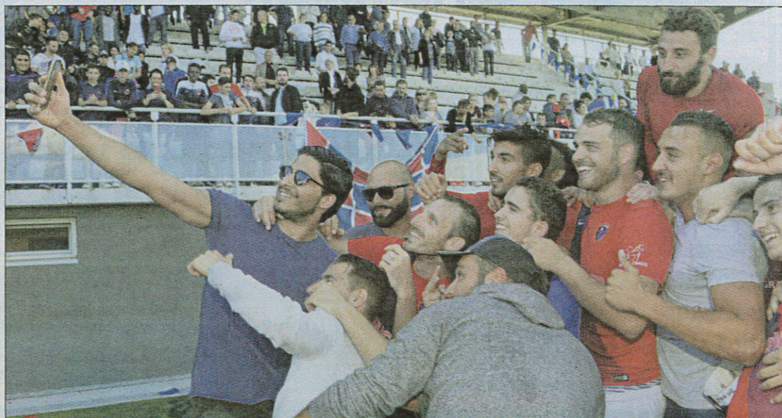
Selfie de rigueur après la victoire, le titre de champion de DH et l'accession en CFA2 pour les joueurs du RC Grasse, hier à La Paoute.