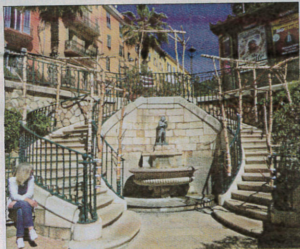
Sur la fontaine du Thouron, les armatures en bois sont déjà en place... reste à ajouter la touche finale: les fleurs!