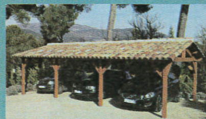
Abri voitures fabrication traditionnelle toutes dimensions

SHOW-ROOM : 213, route de Cannes - GRASSE - Ouvert du lundi au samedi de 9h30-12h00 / 14h00-19h00 www.abrisdeprovence.com