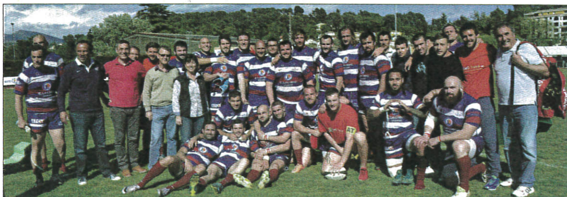
Les « Rouge et Bleu » n'ont pas manqué leur rendez-vous cette saison en Fédérale 1. Rendez-vous après l'été.