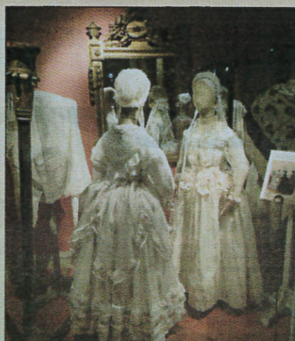
Paris était source d'inspiration pour les femmes provençales.

Dentelles et parures, précieuses provençales au musée provençal du Costume et du Bijou, 2, rue Jean-Ossola. Jusqu'au 31 décembre 2016. Entrée libre. Rens. 04.93.36.91.42.