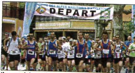
L'an passé, la 19 e édition remportait un franc succès.

Une belle journée en perspective pour les sportifs et tous les autres !