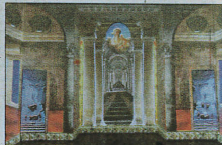
La dernière salle de l'exposition Trompe-l'œil présente des images et vidéos projetées.