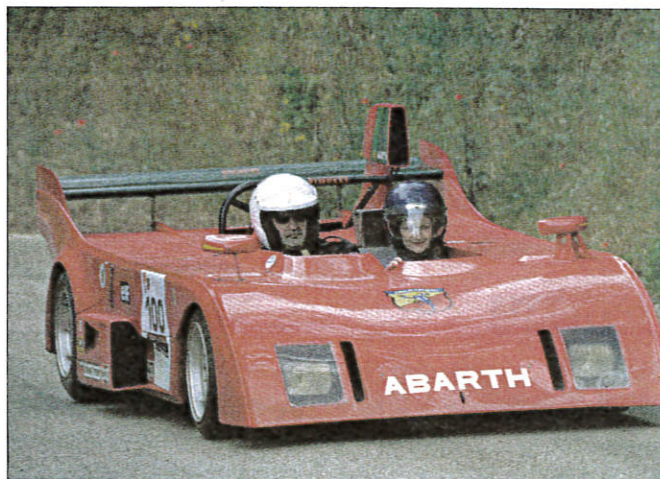
Une barquette Abarth qui a fait son effet hier sur la Route d'Or.

110 véhicules dont une quinzaine de modèles de Fiat Abarth comme la 595 SS, Scorpione SS, Monza, Barquette 014, des Porsche et autre R5 Turbo. Un menu copieux, concocté par Event classic car de Jean-Luc Gambina, pour les amoureux des sports mécaniques. Dans le parc fermé, ouvert à tous !, les scènes habituel-