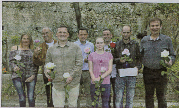
Les obtenteurs et producteurs participant à ce 46 e concours international ont reçu leurs prix lors d'une cérémonie à la Villa Fragonard, hier à 13 heures.

Ci-contre les roses « Charlène de Monaco » de Meilland (Le Cannet-des-Maures), prix du président de la République.