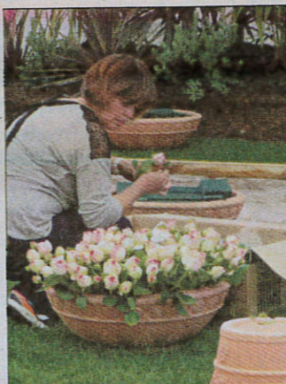
Sous le chapiteau du cours Honoré-Cresp, les fleuristes réalisent les bouquets de roses que pourront découvrir les visiteurs.