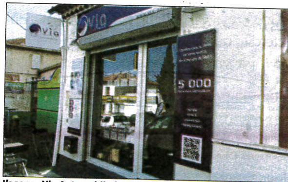
L'agence Via Automobile à Grasse fonctionne comme une agence immobilière.

Comme pour une maison, l'agence organise des rendez-vous entre vendeur et acheteur pour que ces derniers puissent évaluer l'état de la voiture. Les véhicules peuvent également être livrés si la voiture achetée se trouve à l'autre bout de la France.