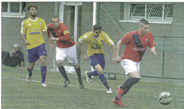
R. K. Les Grassois ne sont plus qu'à une marche de la CFA2.