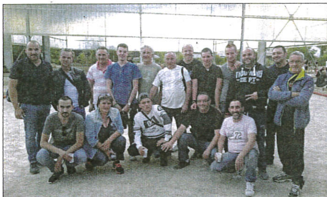
Pas moins de 64 doublettes ont répondu présent à l'invitation de l'ACEPG.

L'Association des Comités d'Entreprise du Pays de Grasse (ACEPG) a organisé son concours de pétanque annuel dernièrement au boulodrome Gaston-De Fontmichel. Et ce fut encore un franc succès pour cette manifestation qui a réuni 64 doublettes. Des engagés enchantés, une belle organisation, une météo au beau fixe... Bref, de bons