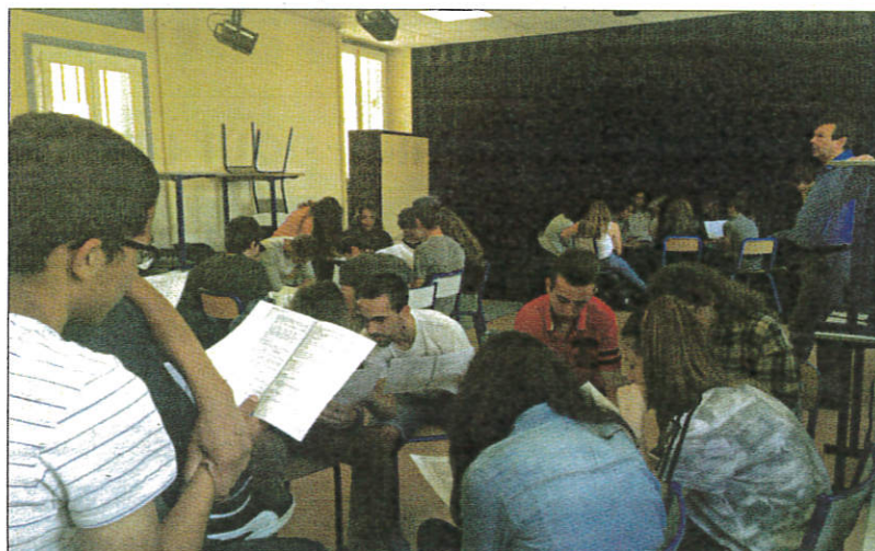
Les élèves de seconde du lycée Amiral-de-Grasse se préparent à interpréter leurs textes.

À peine arrivée, la classe se divise en trois groupes d'élèves, mais « au hasard pour qu'ils participent avec des personnes avec lesquelles