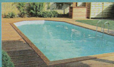
Piscine bois Gardipool