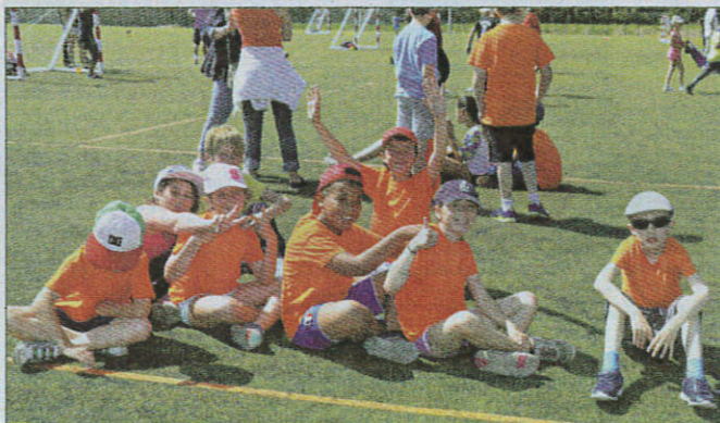
Repos bien mérité... avant de repartir pour un autre match de 8' sous le soleil.