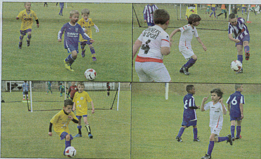
Des dizaines de matches programmés dans la journée pour les apprentis footballeurs qui ont participé, hier, au tournoi des jeunes pousses organisé par l'US Pégomas.