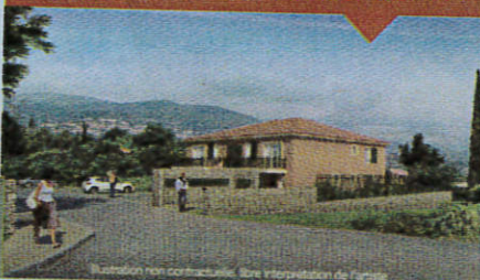
Illustration non contractuelle. Sous interprétation de l'artiste

Tous nos duplex sont équipés d'espace de lumière et de verdure !