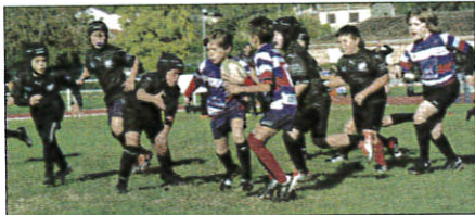
Les jeunes joueurs venus de toute la France vont offrir un sacré spectacle demain dimanche pour la 12 e édition du tournoi Escoz.

Plusieurs trophées sont à l'honneur : le challenge Escoz (meilleur club de toutes les catégories U8, U10, U12), le challenge de l'offensive Nave (club ayant inscrit le plus d'essais sur l'ensemble des catégories), le challenge du fair-play Adequate (meilleur état d'esprit), le Trophée Pacaud (meilleure équipe U6), Trophée Menegon (meilleure équipe U8), le Trophée Ouelha (meilleure équipe