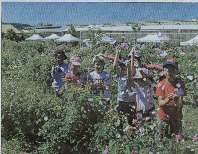
Une pluie de pétales pour fêter la rose Centifolia des jardins du MIP.

Organisé par le Pays de Grasse, en partenariat avec l'Éducation Nationale, le programme d'éducation à l'environnement et au développement durable se compose de différents dispositifs destinés à soutenir et accompagner les enfants dans leurs projets, leur « agenda 21 » ou leur parcours de sensibilisation sur les thématiques