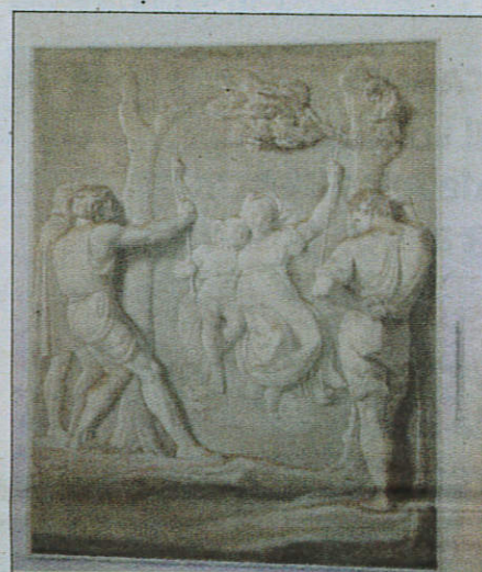
Cette sculpture est en fait un tableau réalisé par Luigi Sabatelli.

Trompe-l'œil, l'art de l'illusion , Jusqu'au 30 septembre. 90 ans de parfum, 1926-2016, Jusqu'au 31 octobre. Musée Jean-Honoré Fragonard, 14, rue Jean-Ossola. Entrée libre. Rens. 04.93.36.02.07.