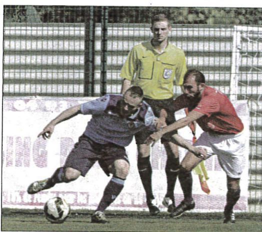
Après le nul 1-1 concédé à La Paoute le 10 avril dernier face à l'AS Cannes, le RC Grasse ne pensait pas repasser devant son voisin lors de la 25 e journée.

Concernant l'erreur de l'AS Cannes, je ne ferai pas de commentaire particulier. Ce sont des choses qui peuvent arriver à n'importe quel club. D'ailleurs, ça nous est arrivé il y a quelques années en arrière. Aucun club n'est à l'abri, même