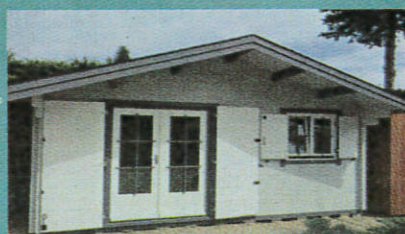
Chalet Jasmin 20 m 2 . Bois massif 58 mm menuiserie double vitrage avec volets

Nombreuses promotions sur produits en magasin