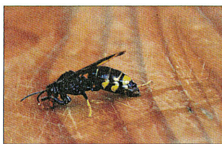
Une motion pour classer le frelon asiatique en danger de 1 re catégorie

Finances : comptes de gestion et administratif 2015 du budget principal.