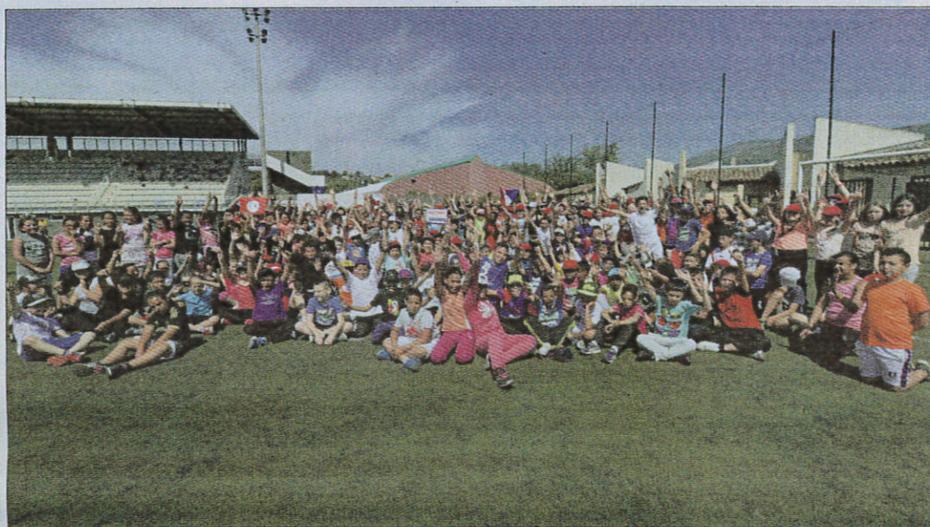
285 élèves de CM1 et CM2 des écoles grasseises ont participé, hier à La Paoute, à la 5 e édition du Mini Grand stade de handball. Avec pas moins de 144 rencontres jouées tout au long de la journée.