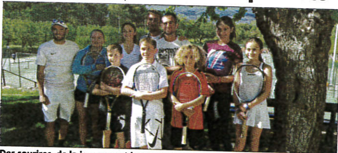
Des sourires, de la jeunesse et beaucoup de verdure.