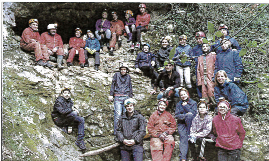
Une belle découverte spéléo pour ces collégiens de Carnot.

La pièce « Régalé-vous Messieurs ! », présentée par la compagnie Le Moral des Troupes, sera donnée au Théâtre de Grasse, le samedi 7 mai, à 20 h. (Parking gratuit). Ce spectacle a pour objectif de collecter des fonds pour Terre Fraternité, au profit des blessés de l'armée française et de leurs familles en difficulté. Tarif : 15 €. Rens., résa et vente de billets : 06.87.47.81.17. jeanpierre.bicail@ville- grasse.fr